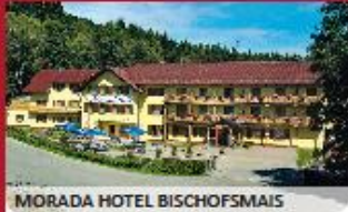
MORADA HOTEL BISCHOFSSMAIS